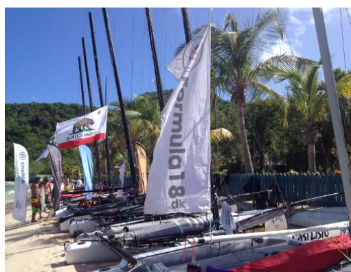
Danmark og VSK var repræsenteret ved St. Barts Catacup.

Store kapsejladser bliver afholdt fra St. Barts i både, der ikke