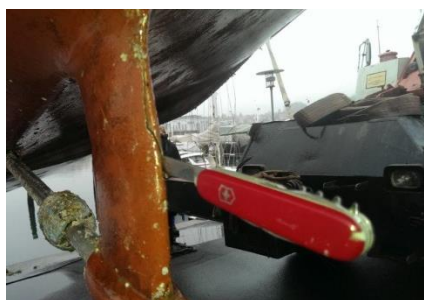
Den flækkede lejubuk. Schweizerkniven viser flækken