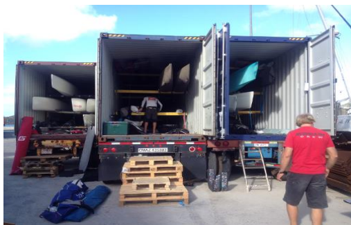
Bådene tømmes fra containerne og samles i 30 °C varme.

Kort og godt skulle vi sejle i krystalblåt vand mod 60 F18-katamaraner på startlinjen, blandt dem nogle af verdens bedste sejlere, og dertil kom 20 professionelle teams. Et eventyr og en kapsejladsudfordring vi bare ikke kunne lade ligge! Og hvem vil ikke gerne til Vestindien i november?