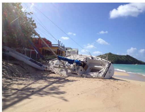
En af de mange forliste både efter orkanen Gonzalo, som hærgede tre uger før kapsejladsen - mange af øens F18-katamaraner gik tabt.

Vi blev overraskede, da vi ankom: Tempoet på St. Barts er ikke sådan, som vi kender det i København. Der går færgen og fly til St. Barts fra nabøen St. Martin, men det er vist også det eneste hernede, som har en tidsplan. Alt er sådan lidt reggae-agtig, alt går på kreol tid ... jo, jo, vi har da taxier, men de